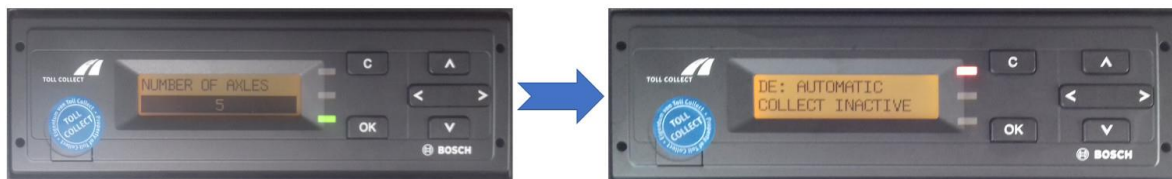
Obr. 2 Zelená kontrolka se vypne a zapne se červená

K dokončení tohoto procesu může být zapotřebí kolem 2 hodin 2 . Finálním krokem je oznámení na jednotce: je nutné nákladní vozidlo vypnout, počkat na to, až se palubní jednotka sama vypne a znovu nastartovat vozidlo (a zapnout palubní jednotku). Nyní je zelená LED kontrolka vypnutá a červená kontrolka je zapnutá, jak je vidět na ukázkách níže - obr. 2.